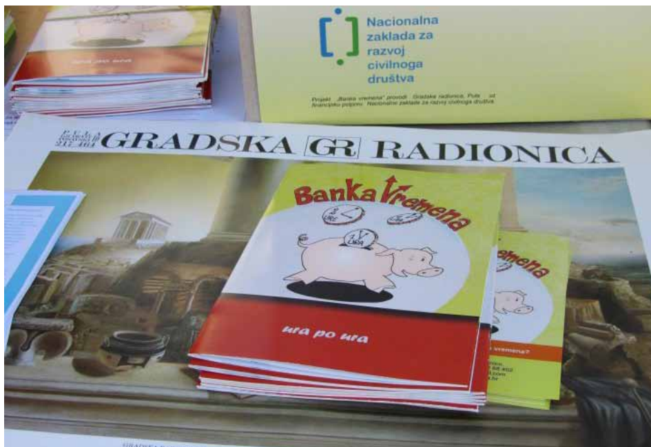
Publikacije Gradske radionice