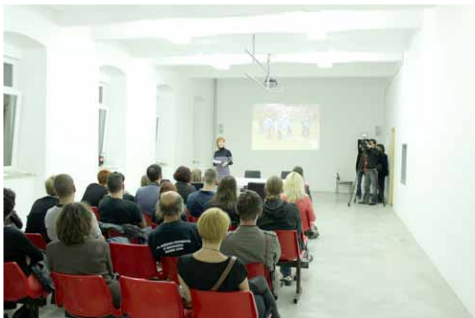
Otvaranje Dnevnog boravka

Nakon otprilike godinu dana ostvarena je jedna od prioriteta Saveza udruga Rojca (SUR) - otvoren je zajednički Dnevni boravak za sve udruge, mjesto za druženje, razmjenu ideja i predstavljanje programa. Iako smo u posljednje vrijeme upravo u tom prostoru (prizemlje Društvenog centra Rojč, hodnikom desno, posljednja vrata s lijeve strane) mogli sudjelovati u 20-ak različitih događanja, (izložbe, buvljak, aktivnosti projekta Stvoreno u Rojcu), vjerujemo da će od sada u ovom novom i obnovljenom prostoru iz dana u dan biti još više korisnih, zabavnih i ležernih druženja. Prostor je opremljen svom potrebnom infrastrukturom za održavanje programa. Udrugama su na raspolaganju projektor, platno, razglas i sl., kao i bijeli zidovi iliti savršena podloga za prezentaciju likovnih, fotografskih i inih uradaka. Naravno, jedan od uvjeta je vratiti prostor u prvobitno stanje, nakon završetka događanja. Prostor ima i novi pod, nove prozore, jedna nova vrata, bijeli veliki stol, nekolicinu novih stolica i jedan ormar... Uglavnom, sve izgleda novo, lijepo i bijelo, što će svakako jednog dana u skoroj budućnosti biti nadopunjeno, jer SUR ima i dodatne planove za uređenje. Primjerice, u zajedničkom prostoru otvoriti čitaonicu i knjižnicu, kao i u jednom dijelu osmisliti prostor za ugodna druženja uz kavu ili čaj. Vjerujemo da će zidovi uskoro biti popunjeni i galerijskim programom udruga iz Društvenog centra Rojč. Vrata Dnevnog boravka širom su otvorena za sve ideje i programe Rojčana.