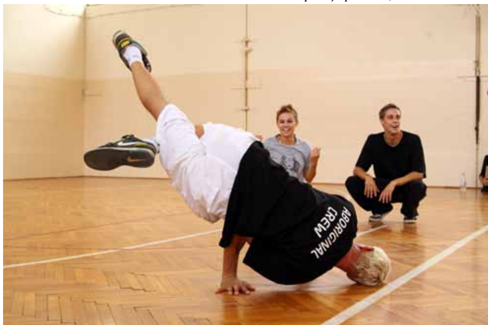
Ovo nemojte pokušavati sami...

lom života. Pored breakdancerca tu se mogu uvrstiti i skateri i graffiteri i DJ-evi i MC-jevi koji se tim glazbenim stilovima bave. Sam naziv dolazi iz dva termina: Break (pauza) i Dance( ples) jer su prvi breakeri izvodili svoje točke u pauzama između drugih izvođača. Sama ideja hip-hop kulture nastala je u Americi 60-ih godina proteklog stoljeća, dok je breakdance u početku služio uličnim skupinama da bi pokazali tko je jači.