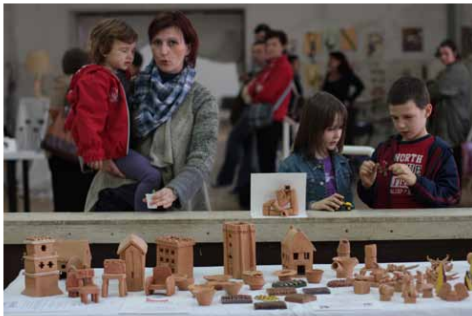
Prikazane su zanimljive rukotvorine