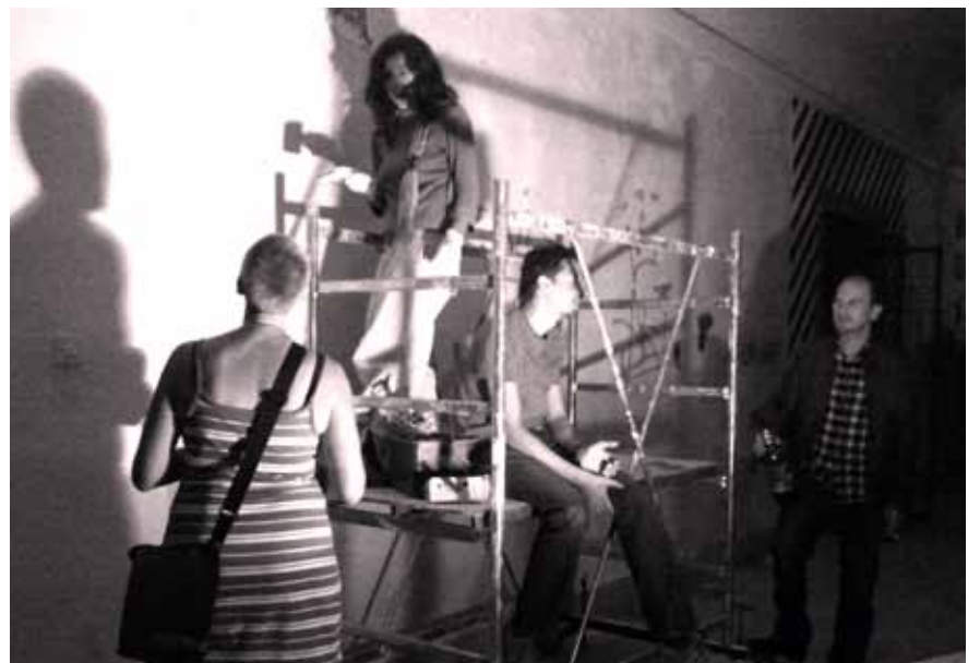
Pripremanje zida za još jednu intervenciju