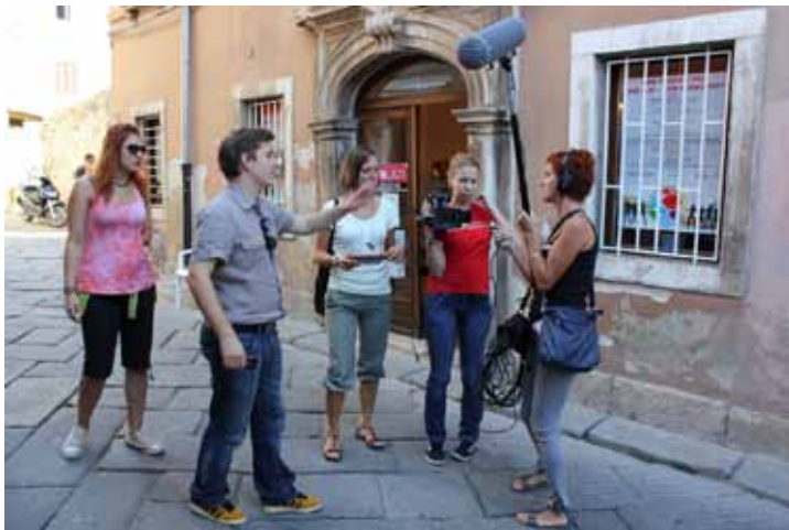
Video sekcija u akciji