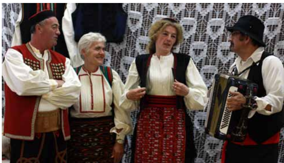
Zasvirala se i harmonika