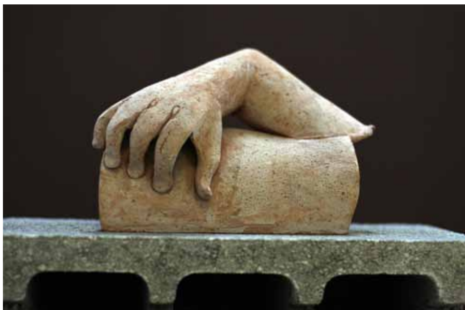
Moglo se vidjeti i vrijednih umjetnina