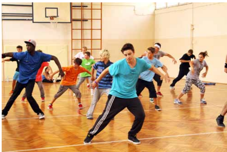
Brejkanje je namijenjeno svim uzrastima

Bilo je to nužno da bismo mogli nastaviti s treninzima i nastupima. Službeno je udruga osnovana u lipnju 2008. godine. Ponajprije smo vježbali ispred pulske robne kuće i toliko redovno da su nam djelatnice počele donositi boce s vodom i podržavati nas u našim nastojanjima. Trenirali smo tako cijelo ljeto, temeljito i ustrajno, ali o najvećem problemu, kojeg smo svi bili svjesni, nismo pričali – nismo imali prostor ili dvoranu za trening, a stizali su hladni dani. Ipak, početkom školske godine, smijeha nam se sreća - Studio Zaro nam je ustupio svoje slobodne termine u njihovoj prostoriji. Riješivši time bar privremeno pitanje prostora, nastavili smo tre-