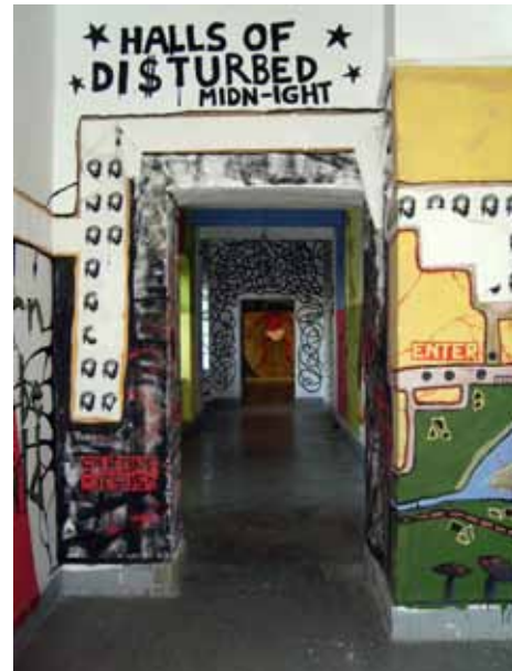
Duhoviti crteži nastali a Krojbergu