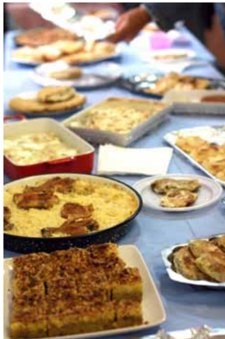
Nitko nije ostao gladan