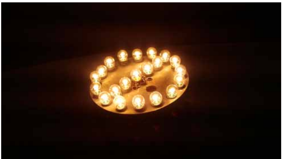
Znak zabranjeno austrijske autorice