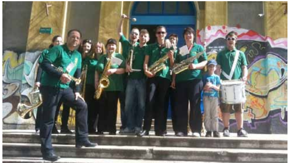
U Puhačkom ne manjka dobre atmosfere

"Kada bi se skupili svi koji su u ovih 19 godina svirali u PO-u, procjenjuje Nataša i nastavlja, bio bi to orkestar od gotovo 200 ljudi! Zanimljivo je da imamo i mnogo obiteljskih veza, pa tako npr. u PO-u zajedno muziciraju otac i dvoje djece, nono i dva unuka, mama i kćer te nekoliko zaljubljenih mladih parova. Imamo i