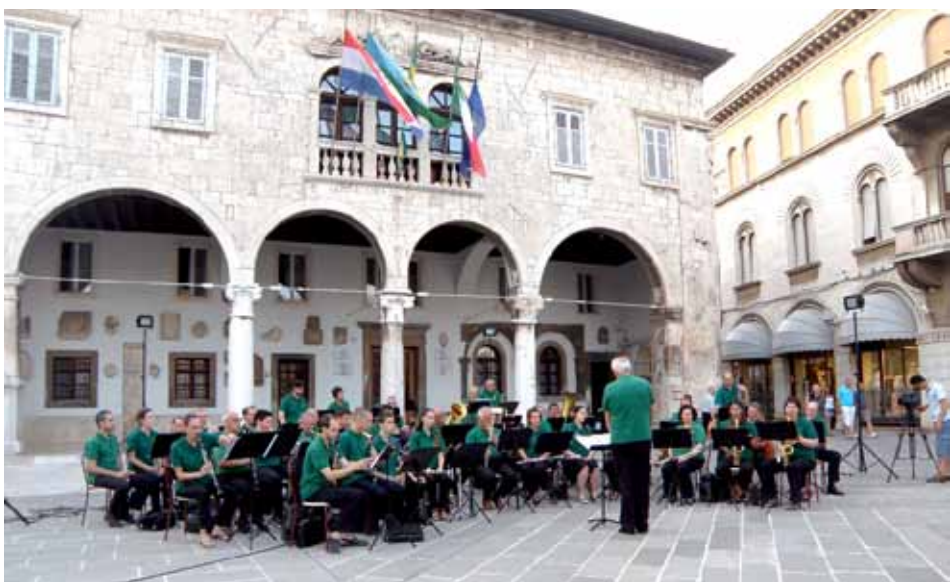
Orkestar ponekad možete čuti i u centru grada

1994.-2012. - odličan na smotrama li-menih glazbi Istre (sudjeluju i puhači s riječkog područja i iz gradova slovenske i talijanske Istre) 1998. - Šibenik - najbolji u A-kategoriji na 3. natjecanju hrvatskih puhačkih orkestara i Zlatna plaketa 2000. - Ravna Gora - Zlatna plaketa u A-kategoriji na državnom natjecanju 2000. - Kopar, R Slovenija - brončana medalja na Međunarodnom festivalu 2002. - Novi Vinodolski - Zlatna plaketa u A-kategoriji, državno natjecanje 2005. - Crikvenica - zapaženi kao jedan od najboljih orkestara na Smotri hrvatskih puhačkih orkestara 2007. - uspješni domaćini 32. susreta puhačkih orkestara Istre: ugostili 20 orkestara iz Hrvatske (Istarska i Primorsko-goranska županija) i R Slovenije te nastupili s gostima Susreta - orkestrom Litostroj iz Ljubljane - združeni u veliki korpus više od 100 glazbenika. Impresivan trenutak susreta bio je kada je Krasnu zemlju na Forumu zajedno zasviralo gotovo 1000 svirača. 2008. - Tajnik Orkestra Željko Riker predložen za nagradu Grada Pule 2011. - Vižinada - 36. susret puhačkih orkestara Istre; gosti na međunarodnom festivalu u Mariboru (jedini iz RH) 2012. - Lovran - 37. susret puhačkih orkestara Istre; gostovanje na međunarodnom festivalu u Malom Lošinj.