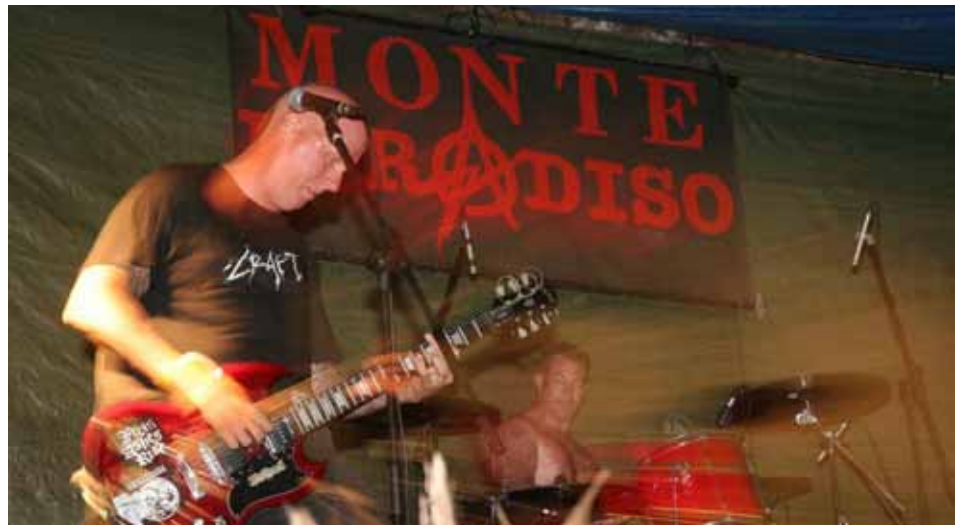
Momci žestoko praše

- Cilj Monteparadiso Hacklaba bio je pružiti ljudima besplatan pristup Internetu, educirati ih o korištenju računala, omogućiti aktivistima djelovanje na elektroničkim medijima, ali, nažalost, jeftiniji ADSL nam je malo poremetio planove. Ljudi su radije bili doma, nego u Rojcu. Više od