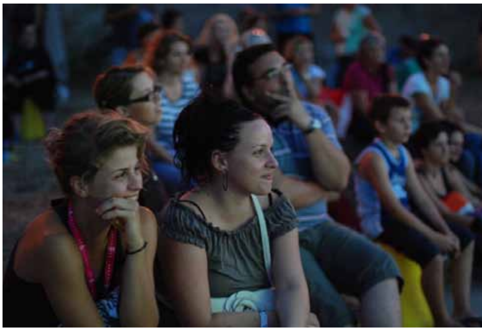
Na projekcijama filmova bilo je svih uzrasta

Ove je godine kino pod zvijezdama obišlo male istarske gradove, kao što su Barban,