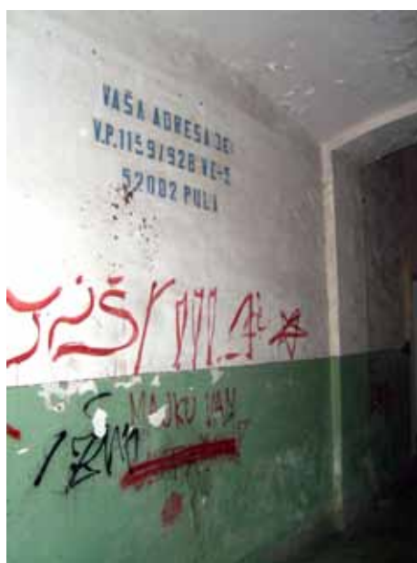
Piši, piši mi...