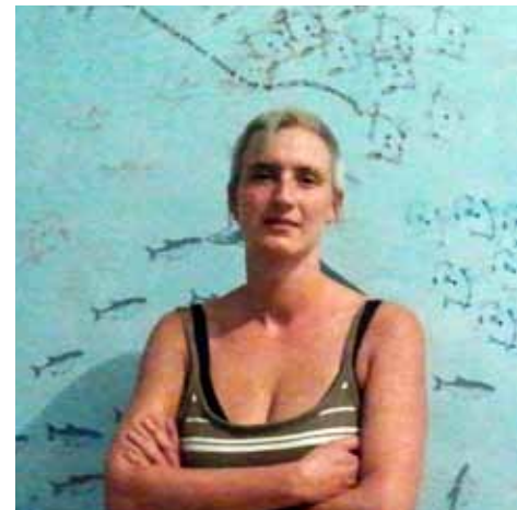
Akvarij Helge Chibidziure

Na pitanje o tome što misli o imidžu stvorenom putem Krojcbberga, Tolić je rekao da podržava ideju koja likovnicima i amaterima pruža priliku za dekoriranje prostora koji je sada i službeno prostor za nezavisnu kulturu. Općenito, cjelokupna ideja je, prema Toliću-