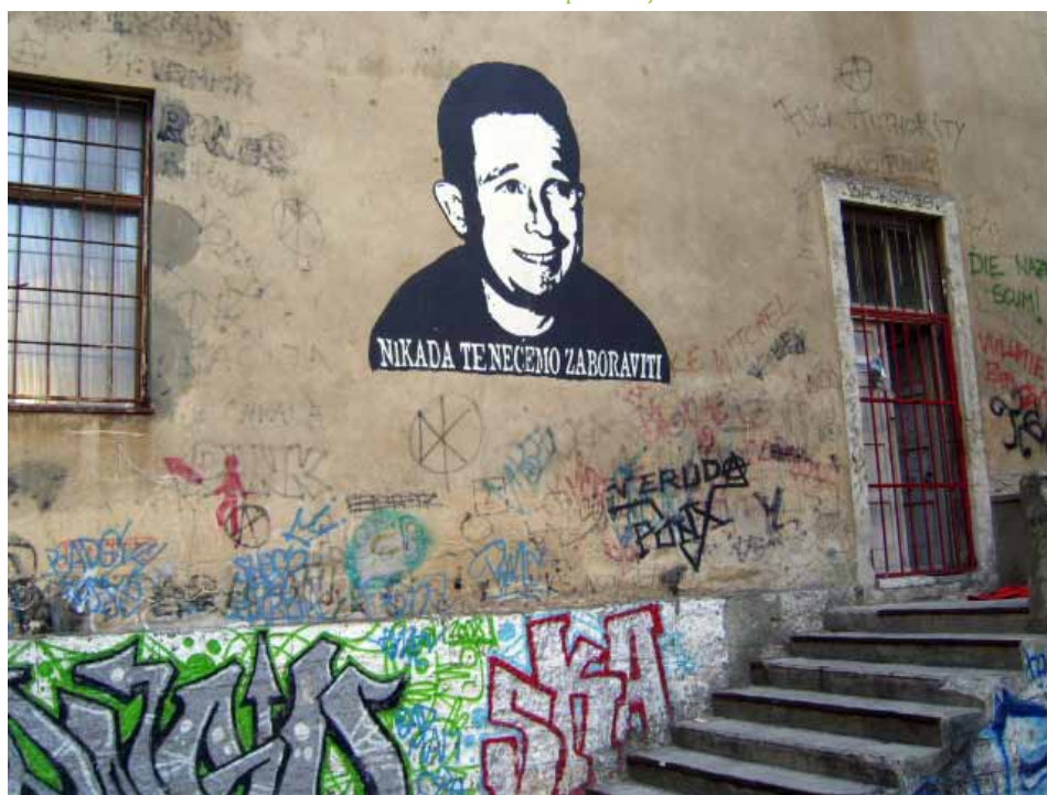
Uspomena na Šelu