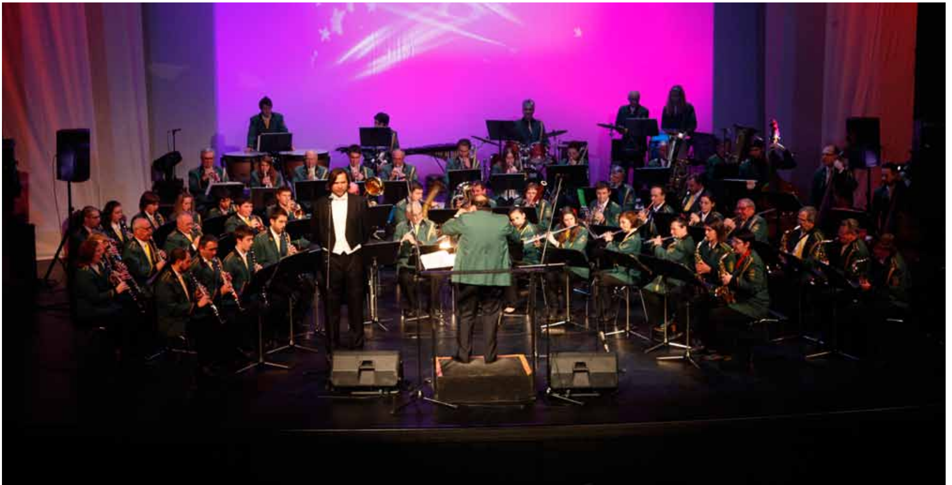
Nastup Puhačkog orkestra u INK