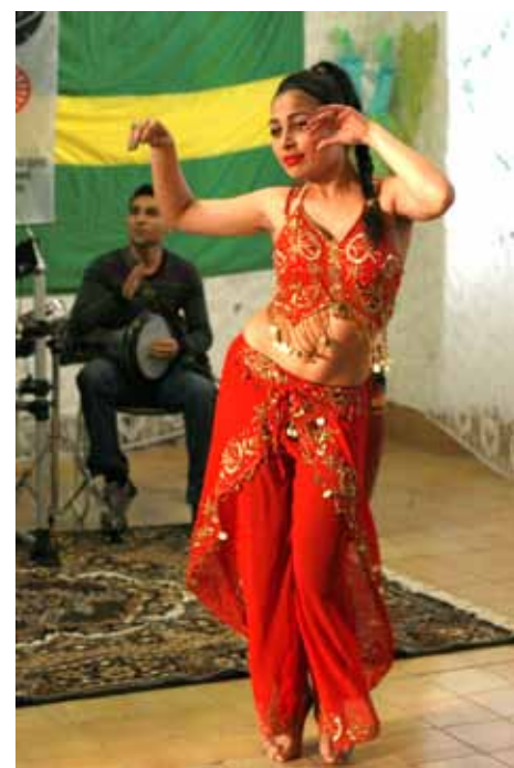
Malo se i zaplesalo