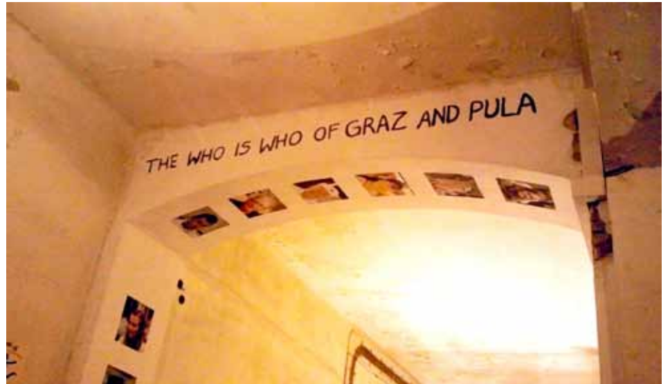
Tko je tko u Grazu i Puli