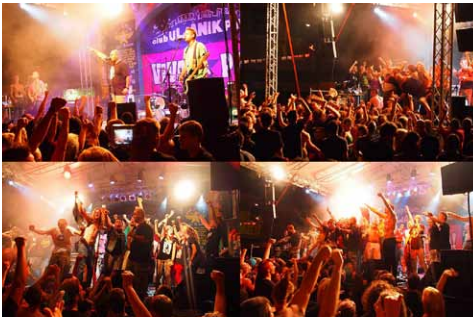
Djelić atmosfere na Viva la Pola festivalu