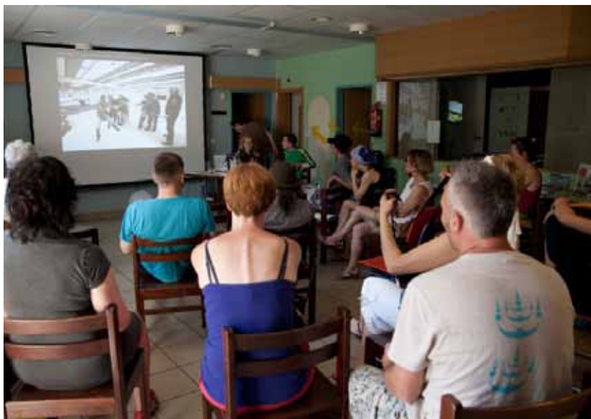
Mnogobrojni sudionici pozorno prate izlaganje