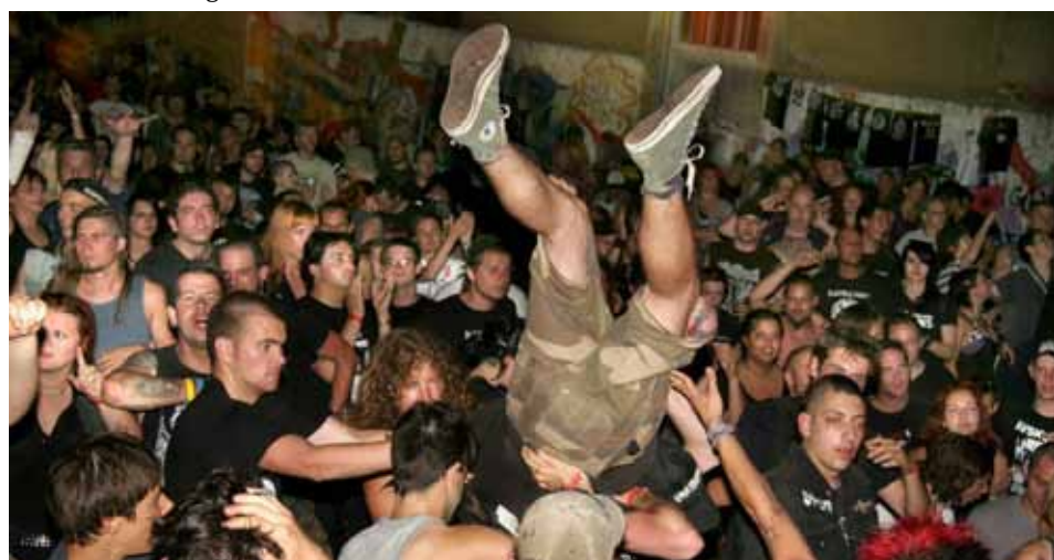
"plesnjak" na MP festivalu

- S Rojcem se učestalost programa povećala. Nismo više bili pod utjecajem hirova različitih vlasnika ili koncesionara prostora, vremenskih prilika pod vedrim nebom i slično. Imali smo svu infrastrukturu, iako smo je možda prekasno sredili. Upravo je tada započelo osipanje najvrjednijih volontera koji su ili pomalo pregorjeli ili otišli trbuhom za kruhom. U jednom trenutku imali smo više od 180 članova koji su plaćali članarinu, prostorije za bendove, itd... Tamo smo mogli i planirati pokretanje Hacklaba koji je bio i povod da se baš u Rojcu održi prvi europski Transhackmeeting.