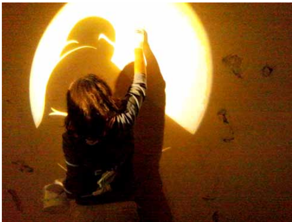
Autorica Susa bavi se ženskom emancipacijom

- Zamislili smo da smo kao javna služba koja uređuje grad, jer Rojc doživljavamo kao grad. Ovdje ima toliko različitih udruga i ljudi, a baš kao na gradskim trgovima i u Rojcu se mogu u isto vrijeme vidjeti biznismen s aktovkom, sportaš u trenerci, majka koja svoje dijete vodi na ritmiku, punker koji pije na stepenicama...Zato se projekt i zove Krojcbberg - kao K(arlo) Rojc - Berg, gdje je Berg sufiks koji se u njemačkom često koristi pri imenovanju gradova - ispričao je Lukarov. Tako je počelo oslikavanje zidova Rojca, tako su nastale instalacije u dvorištu, kao i brojni stripovi.