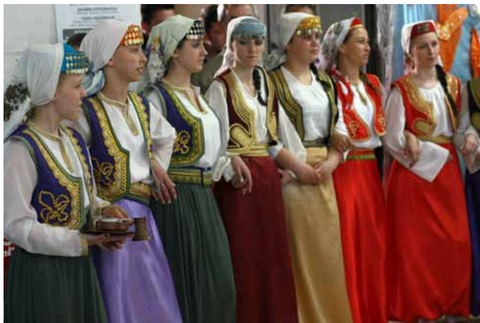
Mladi su ipak zainteresirani za vlastitu povijest i tradiciju