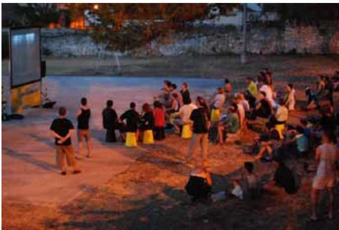
Tražila se i stolica više..

uporabu održive energije te stvara europsku i svjetsku mrežu u kojoj svi partneri imaju koristi te mogu uzajamno učiti i crpiti snagu. Domovina Solarnog kina je Kraljevina Nizozemska. Ovo "čudo" tehnike ima vlastiti solarni sustav napajanja s tri solarna panela koja se nalaze na krovu kombija koji za vožnju