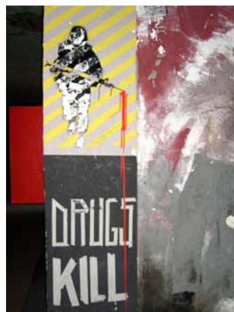
Upozorenje na zidu